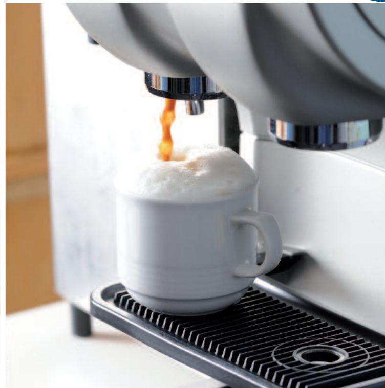
Sekundenschnell ist der «Cafitesse»-Cappuccino zubereitet – perfekter Milchschaum inklusive!