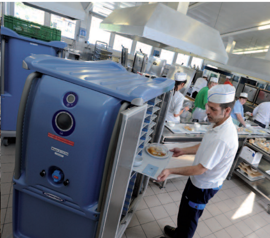
Speiselogistik der neusten Generation: Der Compactserv-Speiseverteilwagen von Steffen Gastro AG, hier in der Ausführung «Senior», eignet sich optimal für das Cook&Serve-, Cook&Chill- und Cook&Freeze-Verfahren.