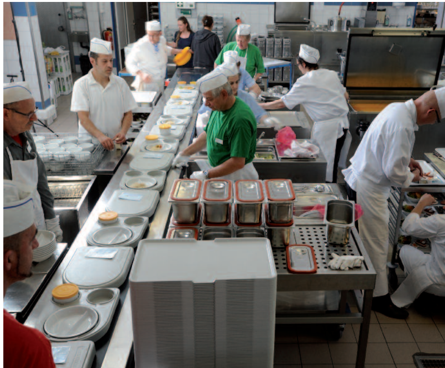
Effizient: Das 25köpfige Team verteilt die Mahlzeiten auf die Gastronorm-Tabletts und bestückt die Speiseverteilwagen, die kalte und warme Gerichte mit einer thermischen Barriere abtrennen.