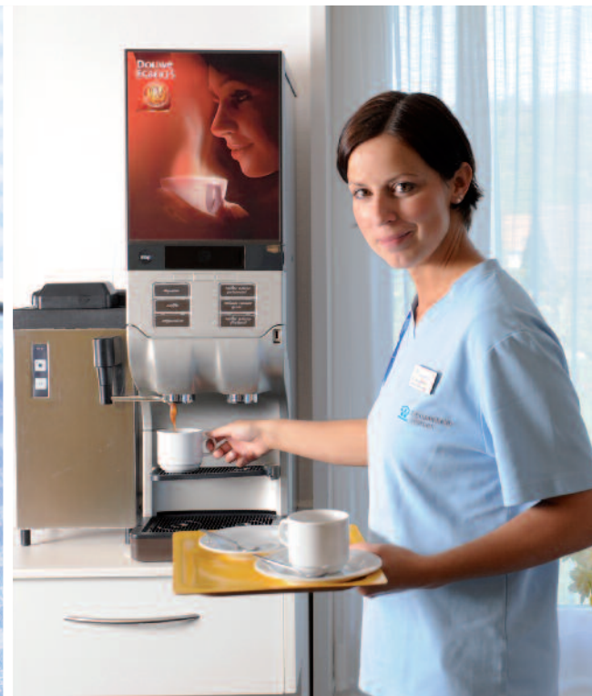
Der Tag im Seelandheim beginnt mit frischer «Züpf» aus der Heimbäckerei und mit duftendem Kaffee von «Cafitesse».

täglich in pasteurisierter Form in den Kaffeespezialitäten.