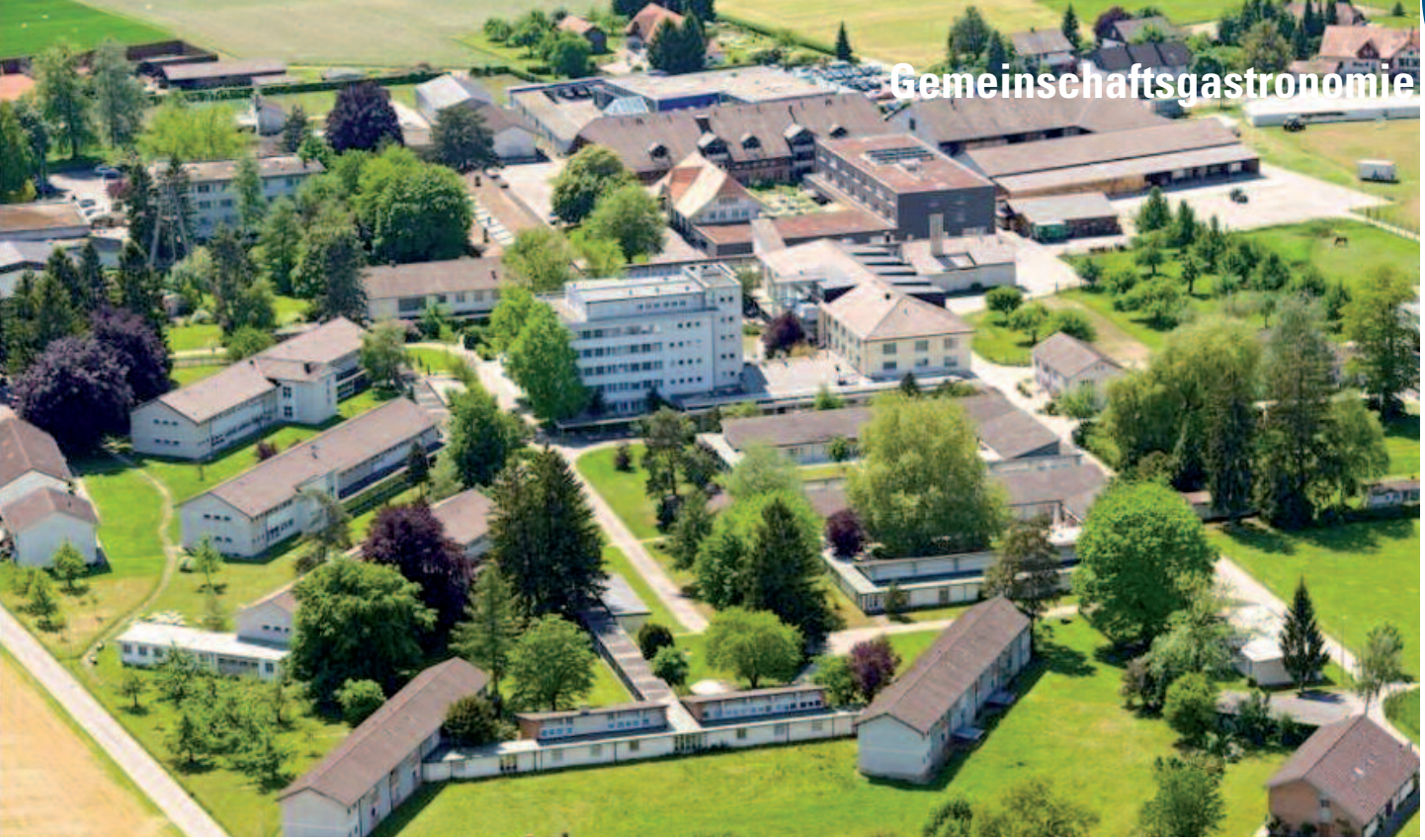
Anlage mit Dorfcharakter: Das Seelandheim in Worben liegt in einer einzigartigen Umgebung.